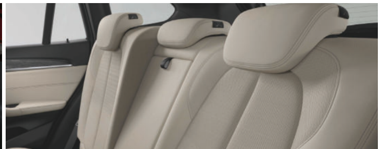
Hàng ghế thứ 2 có thể trượt & điều chỉnh độ ngả