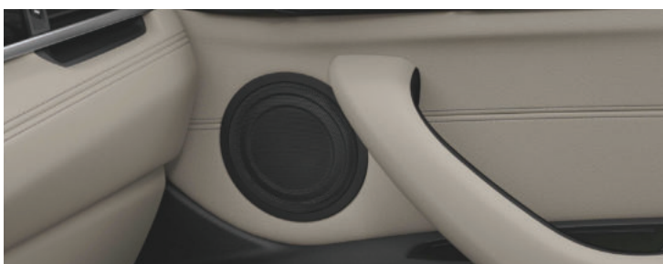
Hệ thống âm thanh BMW HiFi cao cấp