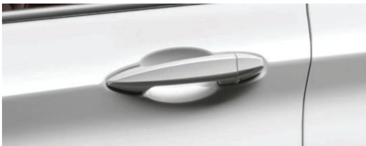
Chìa khóa thông minh Comfort access