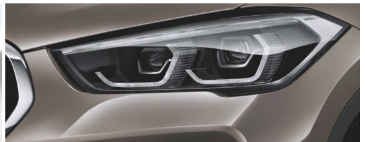
Cụm đèn trước công nghệ LED