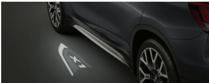
Đèn chào mừng với logo X1